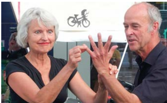
Die „Kleinste Bühne der Welt“ begeisterte zuletzt mit ihren „Drahteseilen“ bei der Spielplatz-Einweihung auf der Maibaumwiese.

Herzlichen Glückwunsch: „Die Kleinste Bühne der Welt“ und „D’Hochleitner“ neue Kulturpreisträger im Landkreis