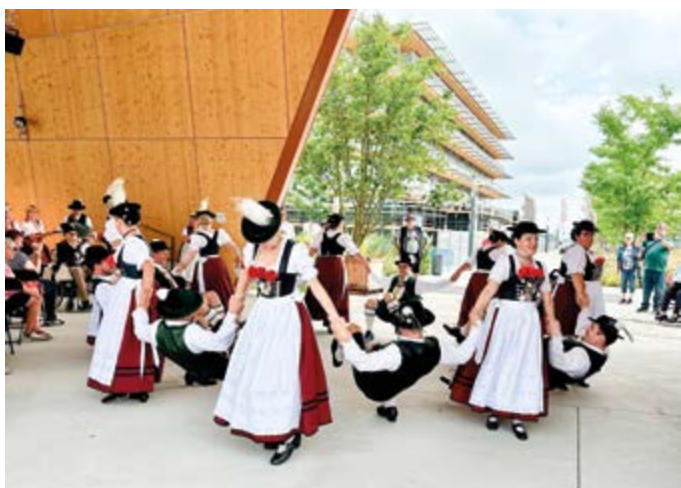
„D’Hochleitner“ waren für die Gemeinde Pullach im vergangenen Jahr bei der Landesgartenschau im Einsatz. Text und Foto: Gemeinde Pullach

Die Preisverleihung findet nächstes Frühjahr statt. Der Termin steht noch nicht fest.