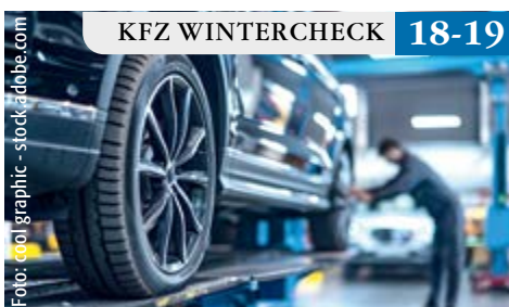
KFZ WINTERCHECK 18-19