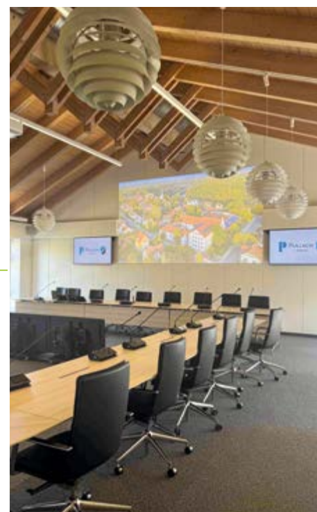
Der große Sitzungssaal im Rathaus nach der Sanierung.

Hallo, ich bin gebürtige Dänin, bin seit 1990 in Pullach und lebe sehr gerne hier. Seit April bin ich in Rente. Ich freue mich über den Gutschein und werde ihn für ein Geschenk einlösen. Pia Pils