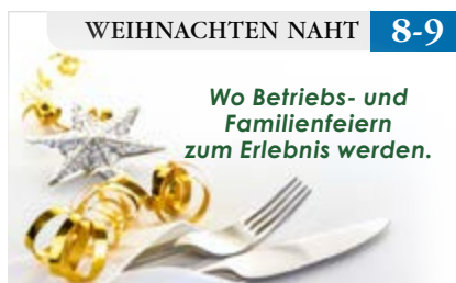
WEIHNACHTEN NAHT 8-9

Wo Betriebs- und Familienfeiern zum Erlebnis werden.